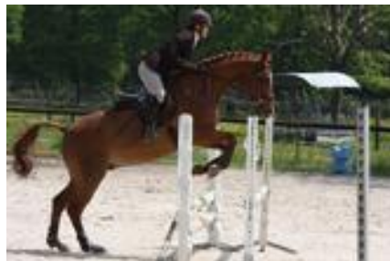
Orbec en concours

Chevaux : Arissa, Bango, Bingo, Quiera, Quime, Dona, Diamant, Violine, Lola .