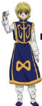
Kurapika, un ami à Gon