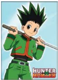
Gon, le personnage principal

Chaque personnage possède une force mystique nommée NEN. Cette force mystique est une technique qui permet d'utiliser et de manipuler sa propre énergie vitale et ses différentes capacités.