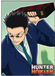
Léolio, un ami à Gon qui aspire à être un hunter