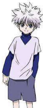
Kirua, le meilleur ami à Gon