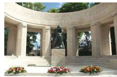
Monument aux morts de Reims

Le 11 novembre, au pied du monument aux morts, un hommage est rendu aux soldats morts au combat.