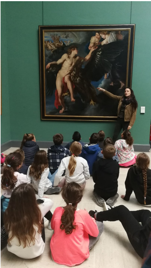
Tableau de Zeus en aigle

Zeus s'est transformé en aigle pour aller chercher Ganymède car c'était un mortel d'une incroyable beauté. Pour rester à l'Olympe, il a dû prendre du nectar et de l'ambrosie. Il va remplacer Ebeé car cette déesse a marché sur sa robe en servant le repas et sa tunique a dévoilé sa nudité donc les autres déesses ne veulent plus qu'elle serve les dieux.